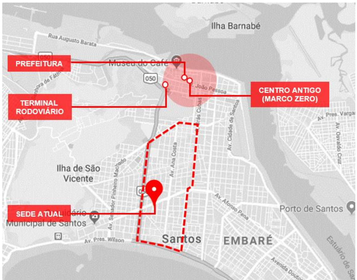
Figura 5 – Perímetro urbano composto pelos bairros com maior concentração de profissionais com destaques para transporte, equipamentos e serviços públicos.

Com maiores concentrações de profissionais e escritórios de arquitetura e urbanismo, observa-se as regiões do Gonzaga, Campo Grande e Vila Matias na cidade de Santos que acompanha os eixos das avenidas Ana Costa, Av. Gal. Francisco Glicério e Av. Dr. Carvalho de Mendonça.