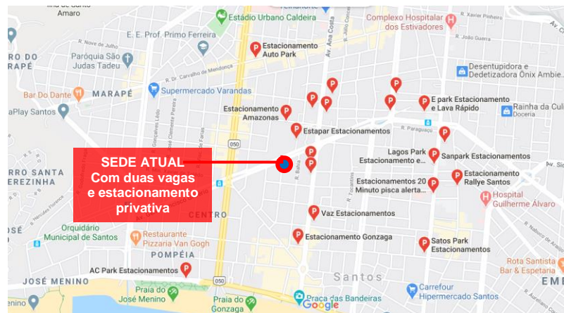
Figura 2- localização atual do Escritório Descentralizado de Santos e estacionamentos no entorno.

Dentre as cidades, destacam-se com maior número de profissionais os municípios de Praia Grande, Guarujá e São Vicente, além da cidade de Santos com 1207 arquitetos e urbanistas ativos.