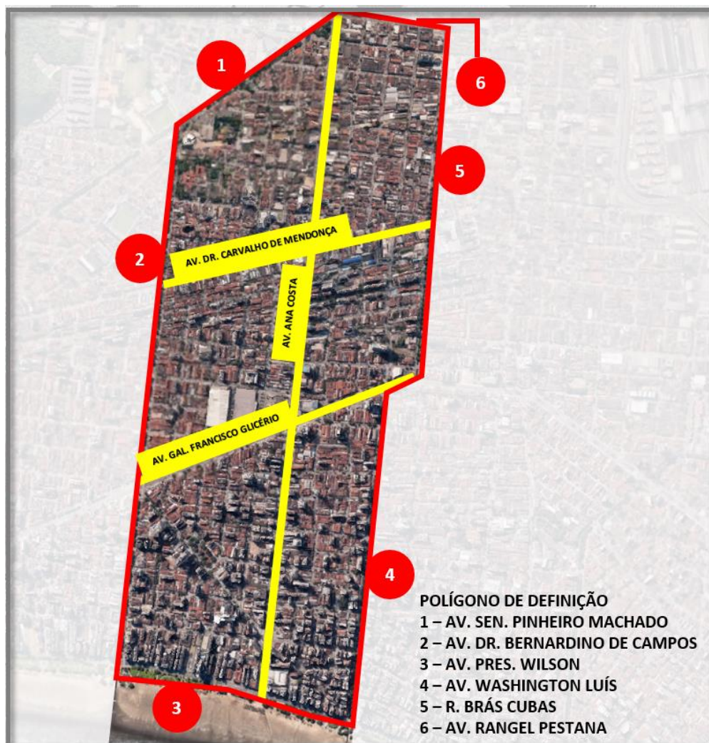
Figura 6 - Polígono de Definição para pesquisa imobiliária.