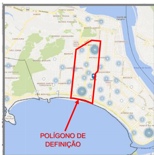
Figura 4 – Gráfico bola da concentração de escritórios de arquitetura na cidade de Santos