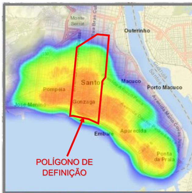
Figura 3 – Mancha de calor da concentração de profissionais na cidade de Santos

Como produto da análise, compatibilizando as informações e grau de importância dos parâmetros apontados pelos funcionários, pode-se definir um polígono composto de eixos viários, como perímetro que circunscribe um recorte da cidade como localidade ideal para possíveis ofertas.