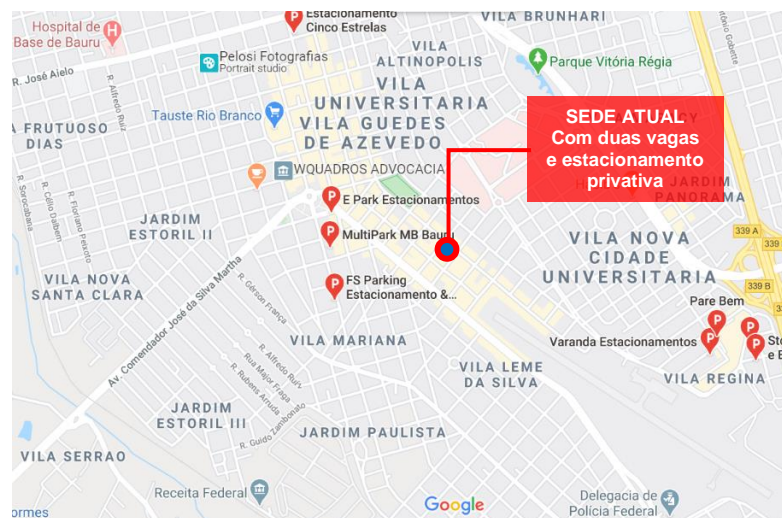
Figura 2- localização atual do Escritório Descentralizado de Baurópolis e estacionamentos no entorno.

Dentre as cidades, destacam-se com maior número de profissionais os municípios de Marília, Ourinhos e Botucatu, além da cidade de Baurópolis com 615 arquitetos e urbanistas ativos.