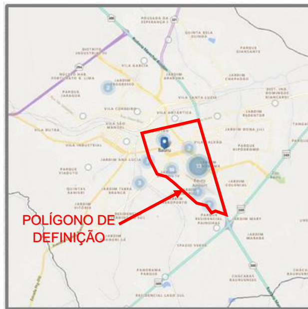
Figura 4 – Gráfico bola da concentração de escritórios de arquitetura na cidade de Bauru

O gráfico de calor 1 (fig. 3), representa a concentração de arquitetos e urbanistas nas áreas da cidade, com gradiente que vai do vermelho (maior concentração) ao verde (menor concentração), enquanto que o gráfico 2 (fig. 4), representa a concentração pontual dos escritórios de arquitetura e urbanismo por áreas da cidade.