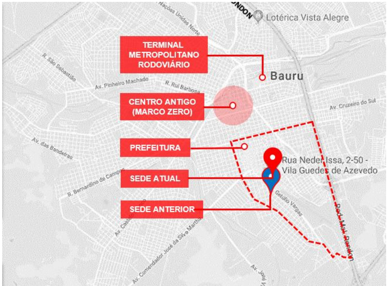
Figura 5 - Perímetro urbano composto pelos bairros com maior concentração de profissionais com destaques para transporte, equipamentos e serviços públicos.

Com maiores concentrações de profissionais e escritórios de arquitetura e urbanismo, observa-se as regiões da Vila Guedes de Azevedo, Vila Nova Cidade Universitária, Vila Mariana e Vila Leme da Silva na cidade de Bauru que acompanha os eixos das Avenida das Nações Unidas, Alameda Otávio Pinheiro Brisolla, Rua Gustavo Maciel e Avenida Getúlio Vargas.