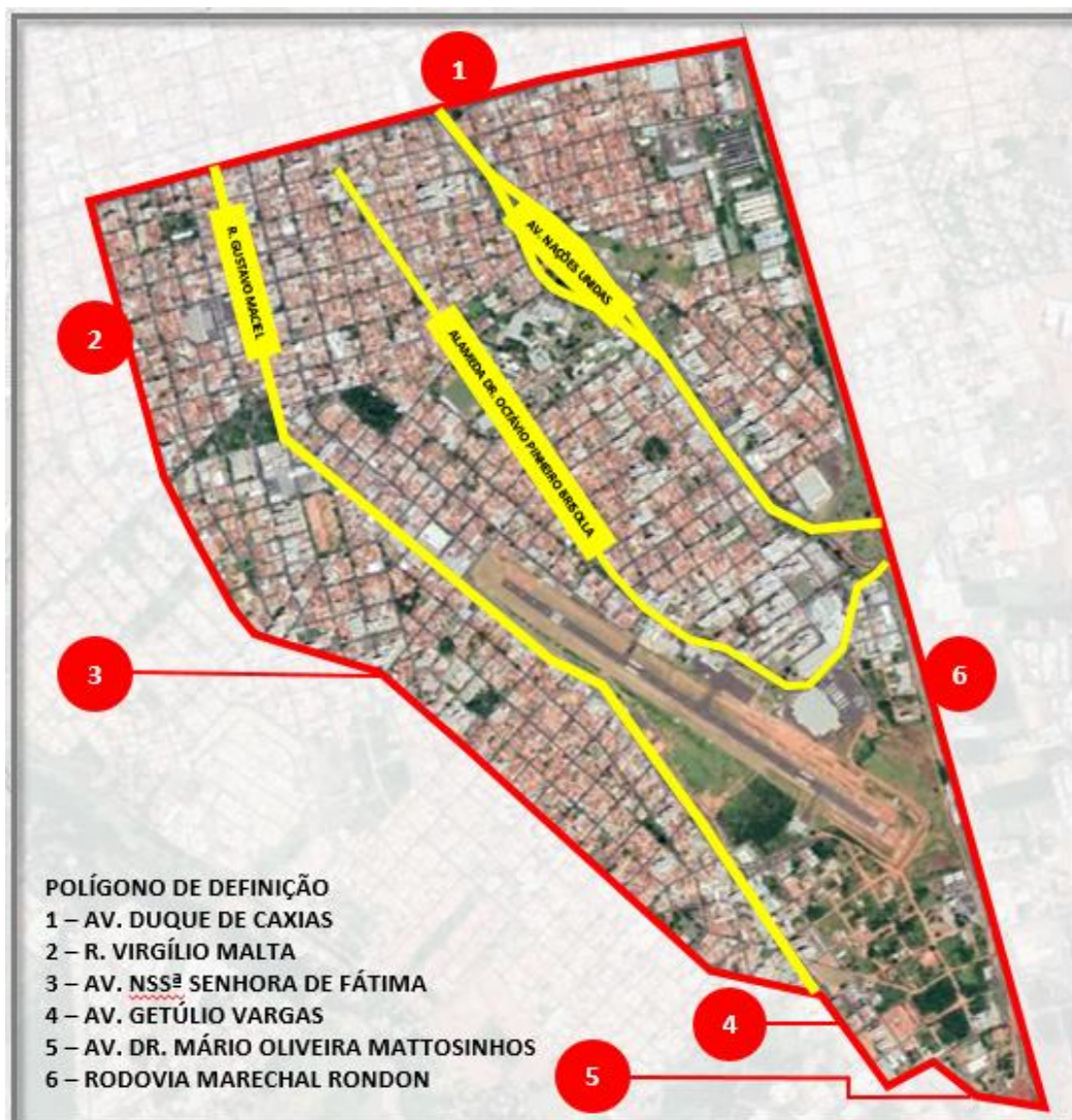
Figura 6 – Polígono de Definição para pesquisa imobiliária.

Portanto, quanto à definição de localização para a nova sede, tomando como base os dados levantados e analisados, fica definida a preferência pela Vila Universitária e Vila Guedes de Azevedo