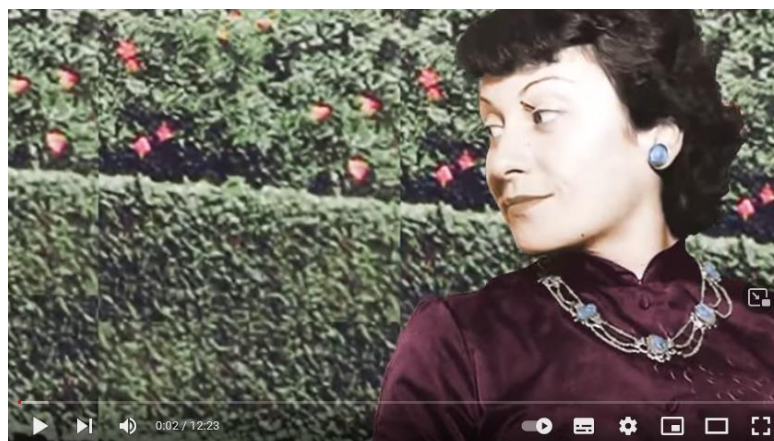
Lina Além do Tempo | Parte 2

( https://www.youtube.com/watch?v=YQ52tK16jKo )