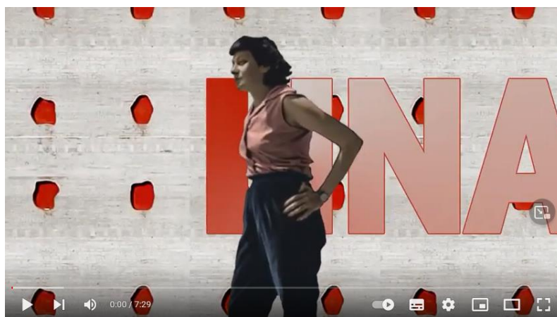
Lina Além do Tempo- Parte 1

( https://www.youtube.com/watch?v=zHTq3dVTuQk )