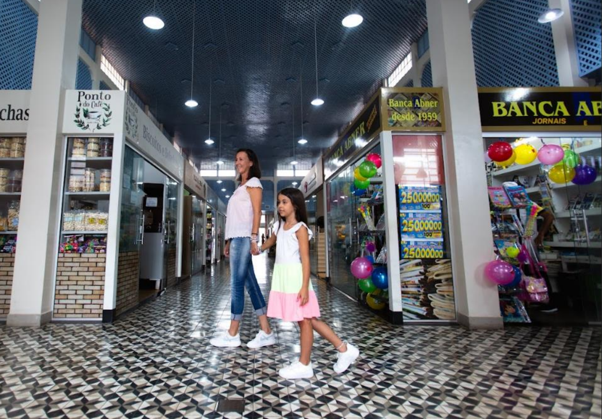
Mercado Municipal- São José do Rio Preto