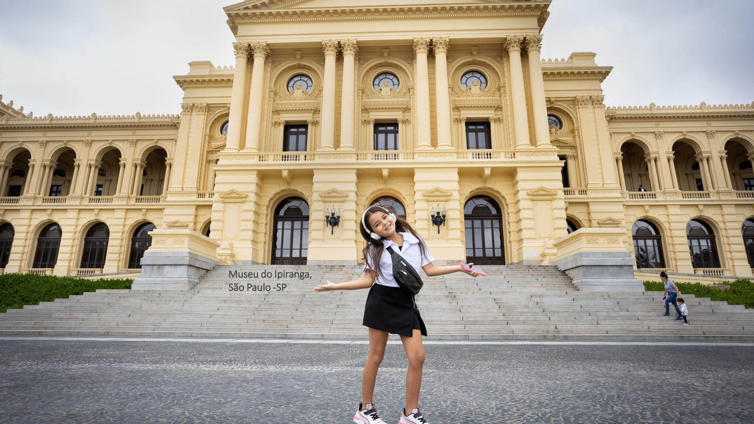
Museu do Ipiranga, São Paulo -SP