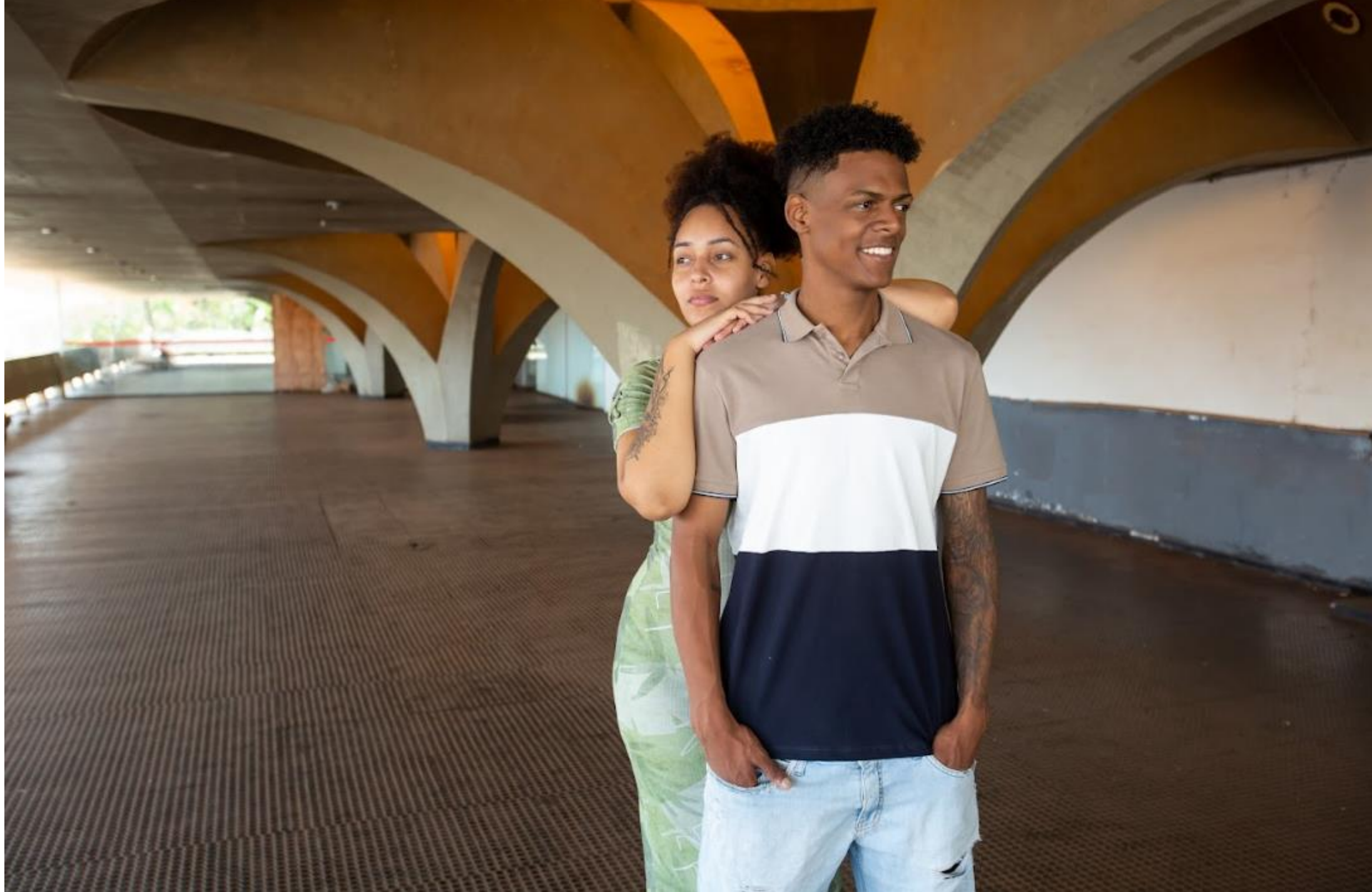
Rodoviária (Artigas)- Jaú