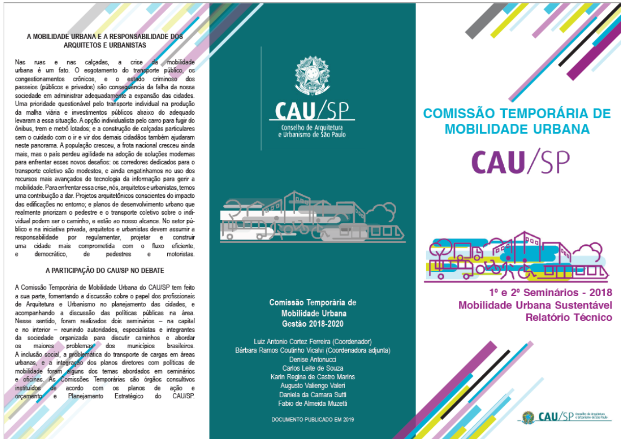
Folder – frente

- Planejamento, execução e confecção de folder de divulgação dos eventos ocorridos em 2018.